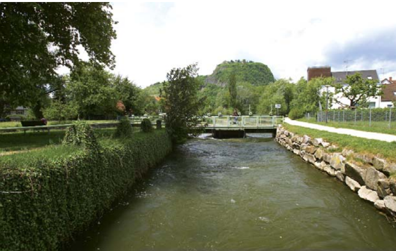
Nutzung der Wasserkraft an der Singener Aach

200 Haushalte. Das Kommanditkapital von über 300.000 Euro war innerhalb kurzer Zeit von rund 50 Bürgern gezeichnet. Es wurden weitere potentiell geeignete Wasserkraftstandorte ermittelt, welche reaktiviert werden sollen.