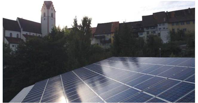
18 kW Kath. Gemeindezentrum, Engen