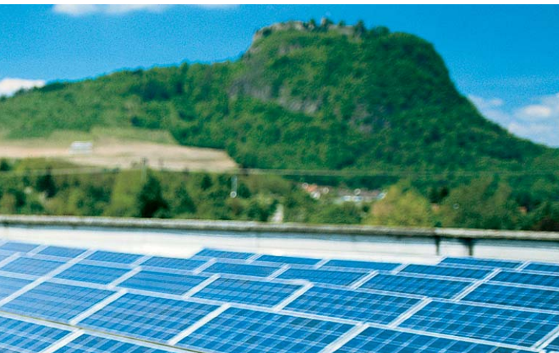
Das erste Photovoltaikprojekt von solarcomplex ist seit 2001 am Netz: 18 kW auf dem Singener Friedrich-Wöhler-Gymnasium

solarcomplex ist ein Bürgerunternehmen mit dem Ziel, die Region westlicher Bodensee bis 2030 weitgehend aus heimischen erneuerbaren Energien zu versorgen. Dieses Ziel ist ehrgeizig, aber machbar.