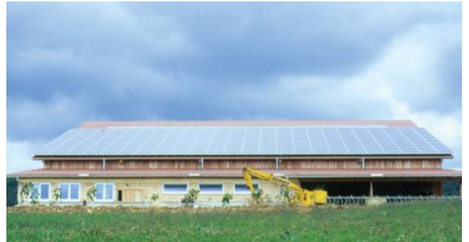
7 x 6 kW Stall Müller, Mauenheim