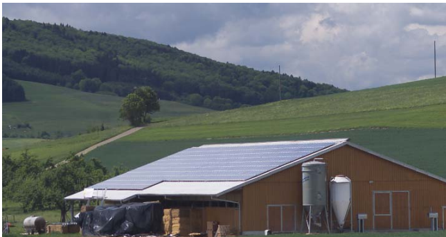
8 x 6 kW Stall Graf, Duchtlingen