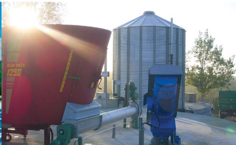
Erste bürgerfinanzierte Biogasanlage in Baden-Württemberg: Hof Schönbuch bei Überlingen

Bisher wurden von solarcomplex im westlichen Bodenseeraum deutlich über zwei Megawatt bürgerfinanzierte