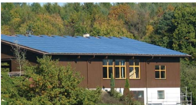
6 x 6 kW Zimmerei Fritschi, Orsingen