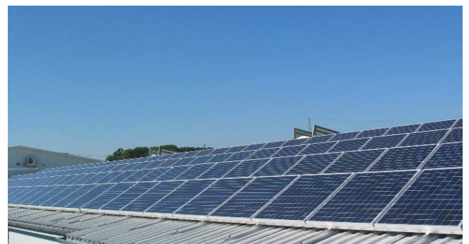
5 x 6 kW Gewerbehalle PML, Singen