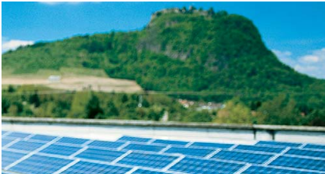
18 kW Friedrich-Wöhler-Gymnasium, Singen