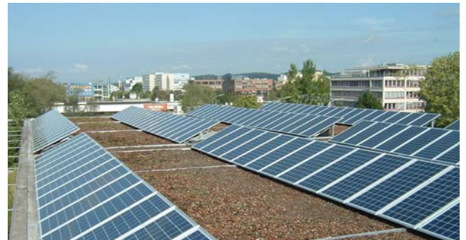
2 x 6 kW Fruchthof, Konstanz