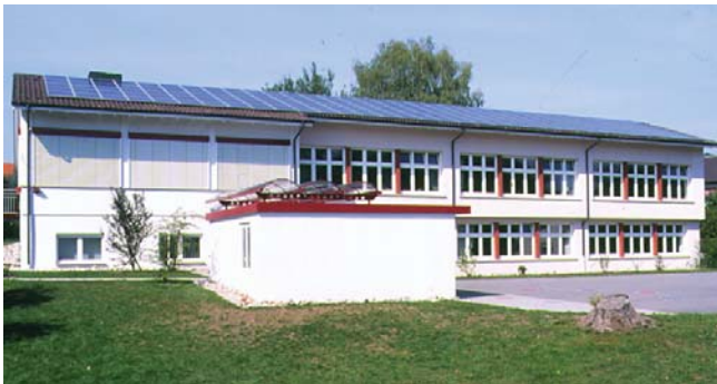
5 x 6 kW Grundschule, Nenzingen